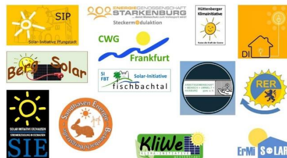
Abbildung 4: 13 weitere Logos von Kooperationen ab Anfang 2022

Mittlerweile sind weitere Initiativen geschult, die sich noch im Herbst 2022 an Sammelbestellungen beteiligen wollen. Damit kooperieren jetzt 30.