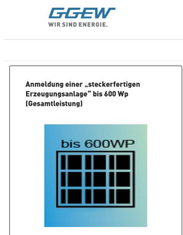
Abbildung 2: Im Web dieses Symbol wählen

Das Formular gibt es nur nach Anmeldung im Kundenportal. Nach einer Intervention von BergSolar aus Bensheim im Febr. 2022 gelten bei der GGEW AG nun die gleichen Regeln wie bei e-netz Südhessen.